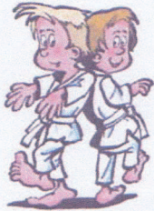
Gemeinsam im Stand