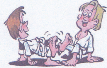
Kämpfe um Positionen